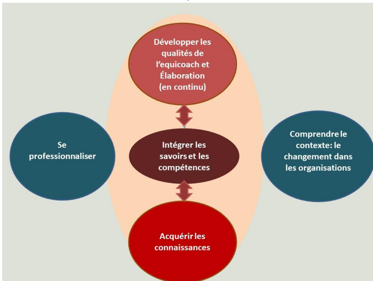
Architecture générale de la formation

La formation est organisée en quatre modules éventuellement capitalisables.